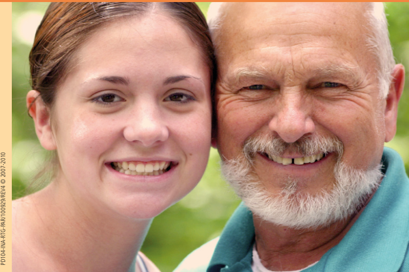
PD104-INA-RTG-PAR/10092/REV4 © 2007-2010

Durch den kontinuierlichen Reiz der Implantate werden diese Mechanismen dauerhaft reguliert und aktiviert.